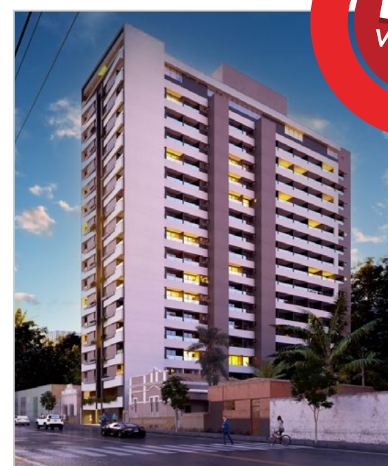
My Place Frei Cândido

O principal destaque é a linha de produtos My Place. Apartamentos flat com infraestrutura completa e localizações privilegiadas em diversos municípios mineiros. Um projeto grandioso e inovador que trará mais modernidade e oportunidades para Pará de Minas.