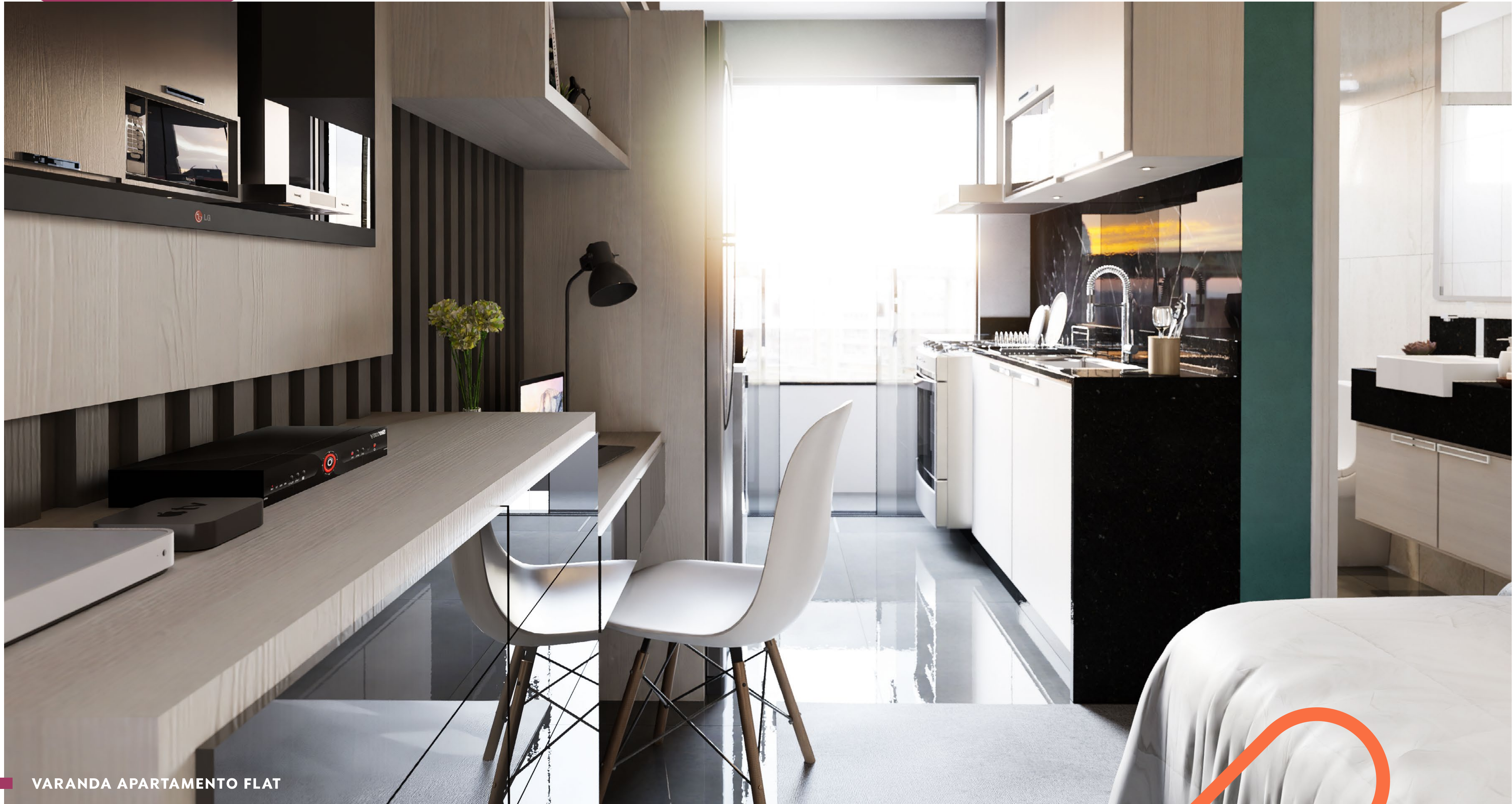
VARANDA APARTAMENTO FLAT